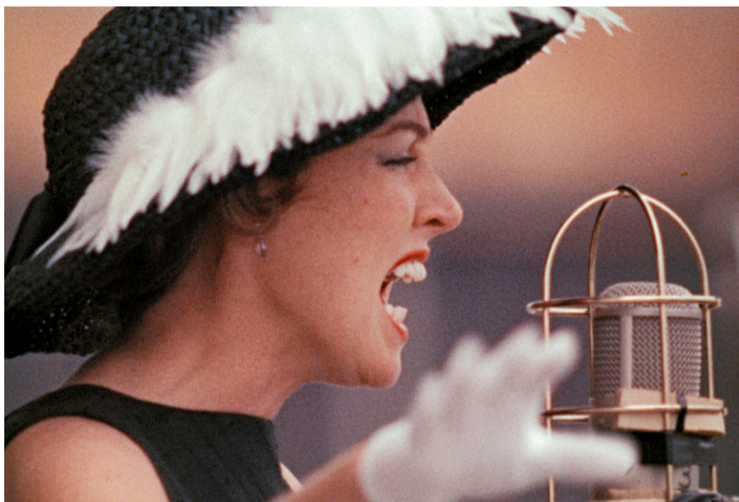
Jazz on a Summer's Day